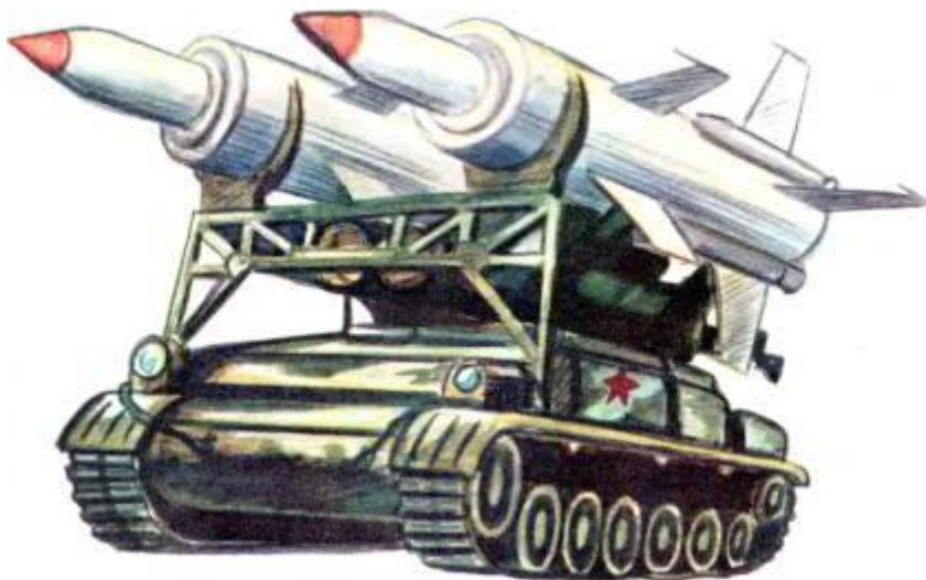
Современная ракетная установка.

Советские воины и в мирное время готовы на подвиг. Ты помнишь улицу имени лейтенанта Басова?