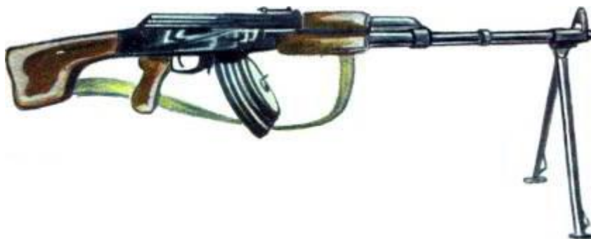
Ручной пулемет Калашникова.

Ещё бы! Андрейка прекрасно помнил эту историю, потому что не раз пересказывал её ребятам. Случилась она во время тактических учений.