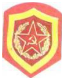
Нарукавный знак формы одежды солдата мотострелковых войск.

Закончив объезд войск, Маршал поднялся на трибуну Мавзолея. И произнёс речь. Тихо-тихо стало на площади...