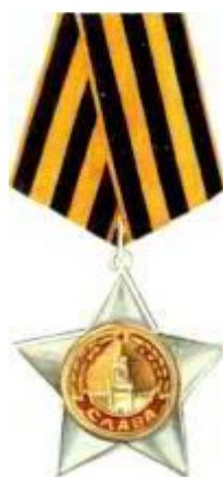
Орден Славы II степени.