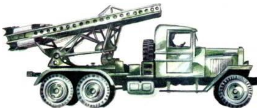
Гвардейский миномёт «Катюша».