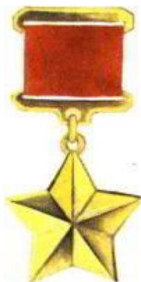
Золотая Звезда Героя Советского Союза.