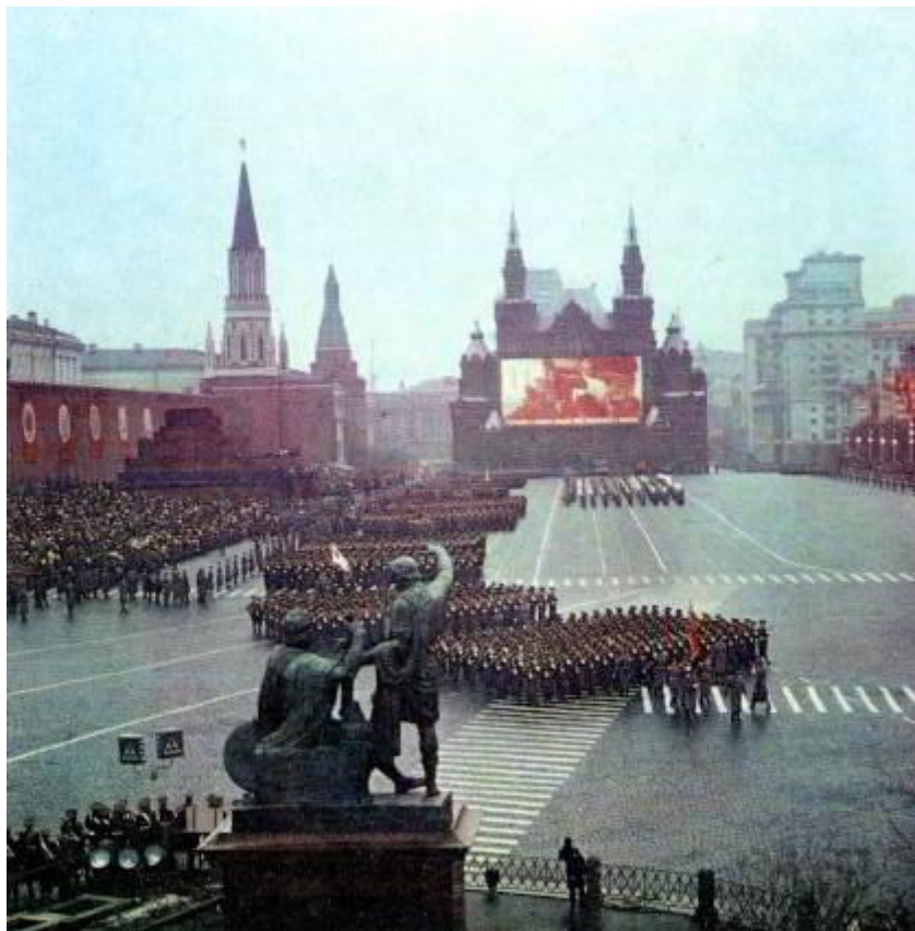
Парад на Красной площади.

Андрейка засмотрелся на знаменосца, который шагал впереди строя. Он был богатырского роста и крепко держал в руках красное знамя, увитое длинными шёлковыми лентами. Каждая из них означала боевую награду. А слева и справа от знаменосца – офицеры с обнажёнными клинками. Их называют ассистентами. Горела на солнце, блестела серебром сталь. Не мог отвести от неё глаз Андрейка. Вот бы ему такую сабельку! Хоть на время, чтобы в руках подержать! И ещё бы эту алую ленту, обшитую золотом, которая через плечо у каждого ассистента. Он хотел было сказать об этом дедушке, но увидел, что тот встал вдруг по стойке «смирно» и приложил руку к козырьку фуражки. Дедушка отдавал честь своей родной академии имени прославленного полководца гражданской войны Михаила Васильевича Фрунзе. Андрейка знал, что под командованием Михаила Васильевича Фрунзе сражался народный герой Василий Иванович Чапаев.