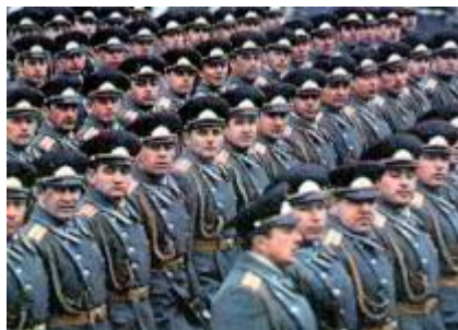
Офицеры – слушатели военной академии.