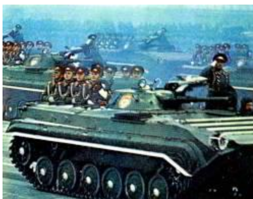
Боевая машина пехоты.