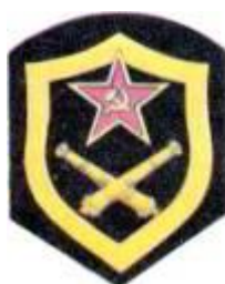
Нарукавный знак формы одежды солдата-артиллериста и ракетчика.