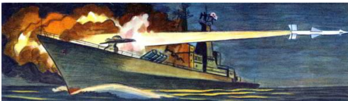
Ракетный залп современного крейсера.