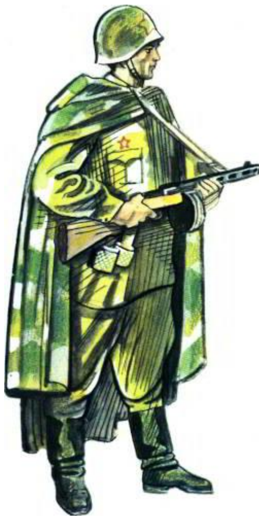
Солдат-мотострелок периода Великой Отечественной войны.