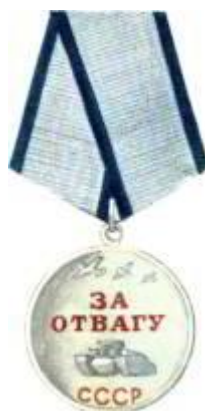
Медаль «За отвагу».