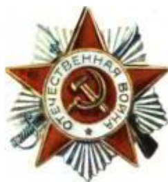
Орден Отечественной войны II степени.