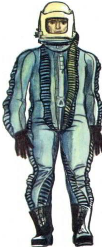
Военный лётчик в высотном костюме.

машиной? Сотни людей трудились над ней: конструкторы и инженеры, техники и рабочие. Нет, не имеет право офицер бросать свою машину – такую быстроходную, такую грозную для врагов! Стремительно приближалась земля. Неумолимо отсчитываются секунды на приборной доске. И вот, почти у самой земли, лётчику, наконец, удалось запустить двигатель. Машина вновь стала послушной... И была спасена!