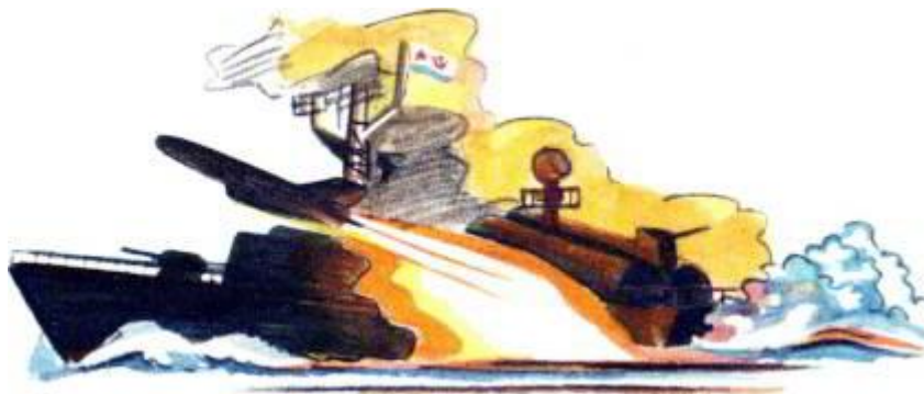
Огонь ведёт ракетный катер.