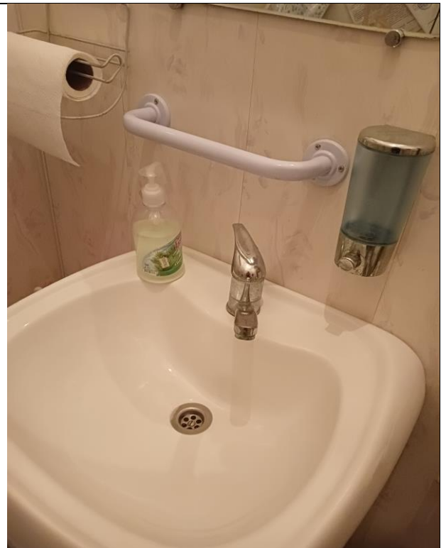
Поручень «Рыжий кот» 2708, белый, 10*36,586,3