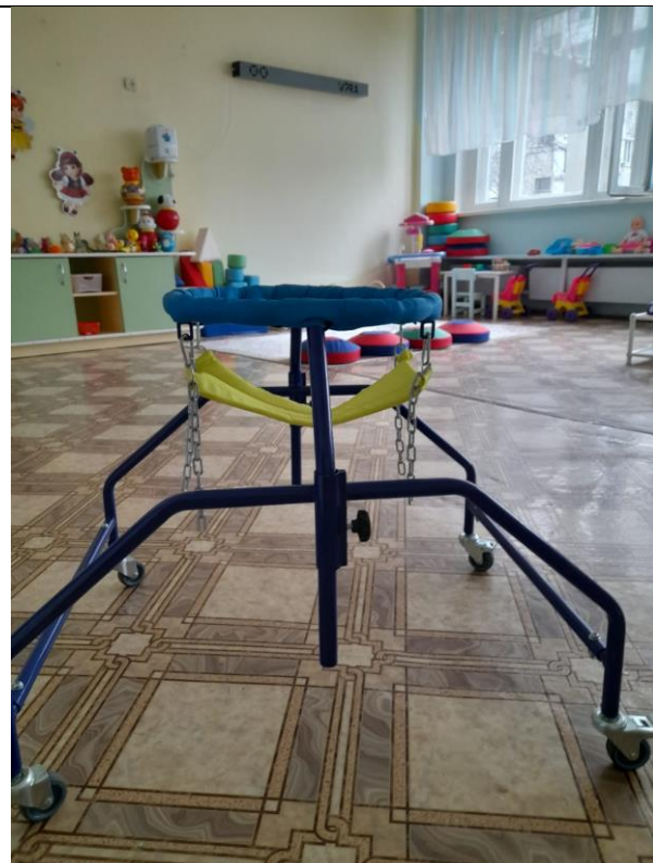
Ходунки – опора для детей с ДЦП FS963L 4 колеса