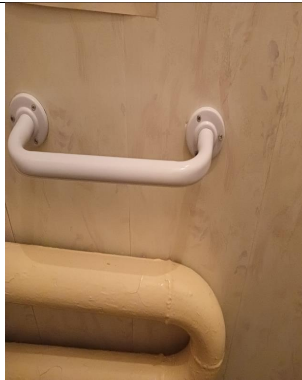
Поручень «Рыжий кот» 2708, белый, 10*36,586,3