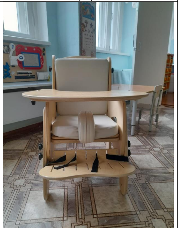
Детский ортопедический стул с приставным столиком и приставкой для ног