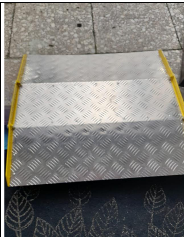
Пандус для инвалидной коляски, перекатной с контрастными бортами безопасности из рифленого алюминия (на улице)