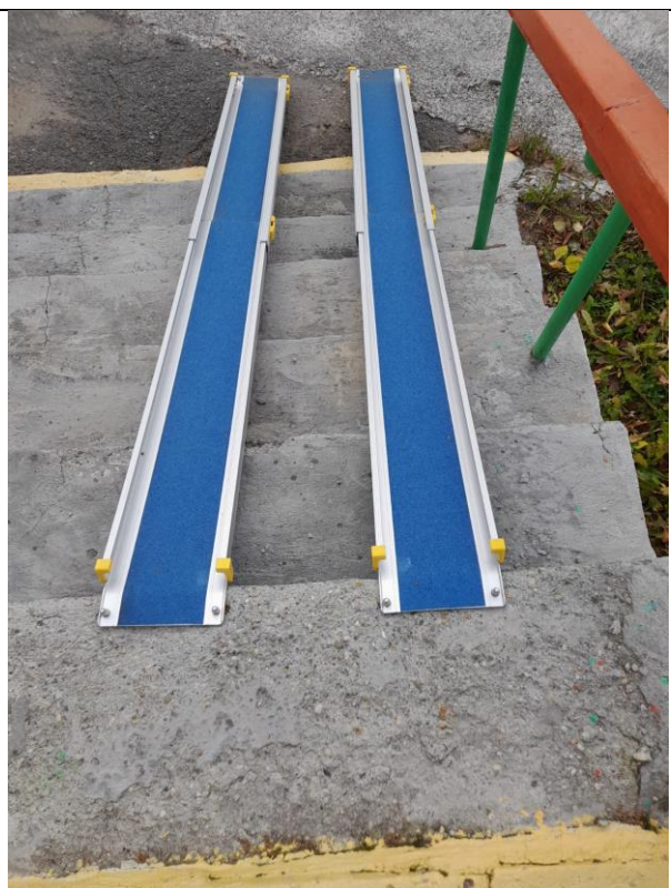
Мобильный пандус телескопический 2-ух секционный МЕГА 2ПТ-210 (на улице)