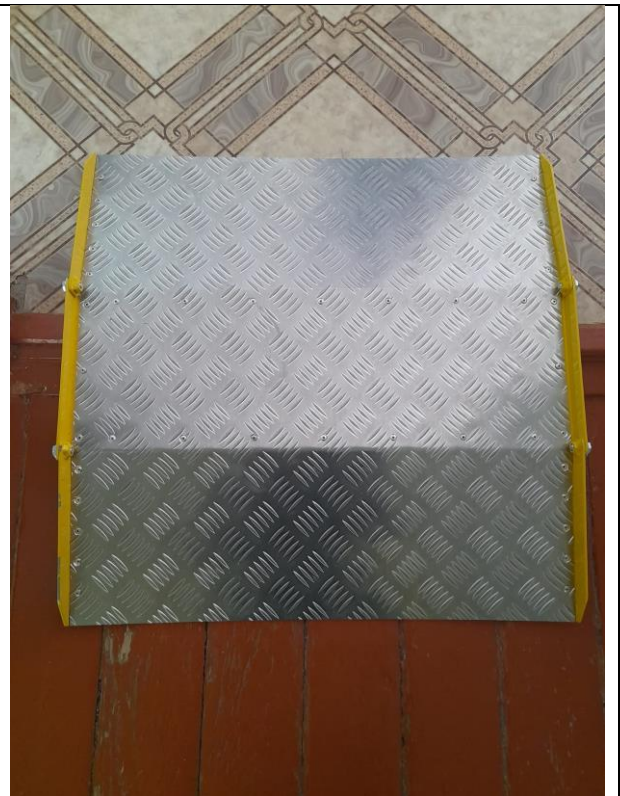
Пандус для инвалидной коляски, перекатной с контрастными бортами безопасности из рифленого алюминия