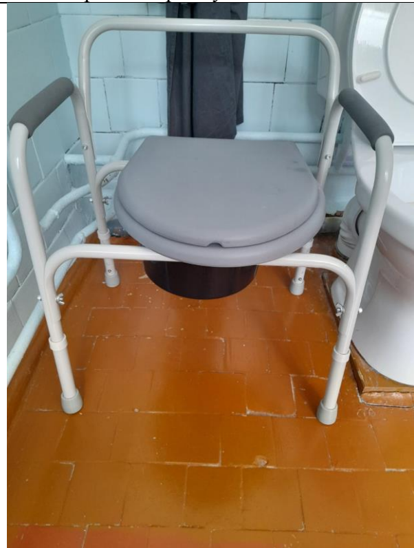
Кресло туалет Армед ФС810 (с регулировкой высоты)