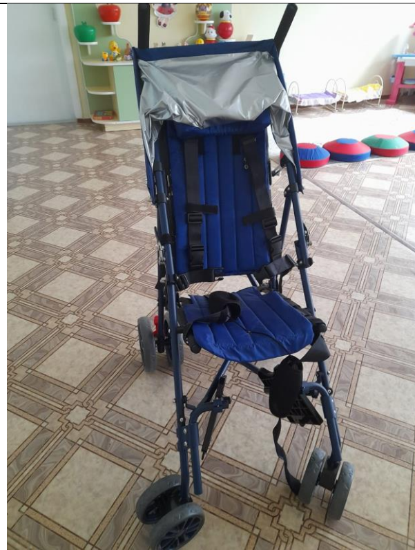
Кресло-коляска для детей с ДЦП Армед FS258LBJGP