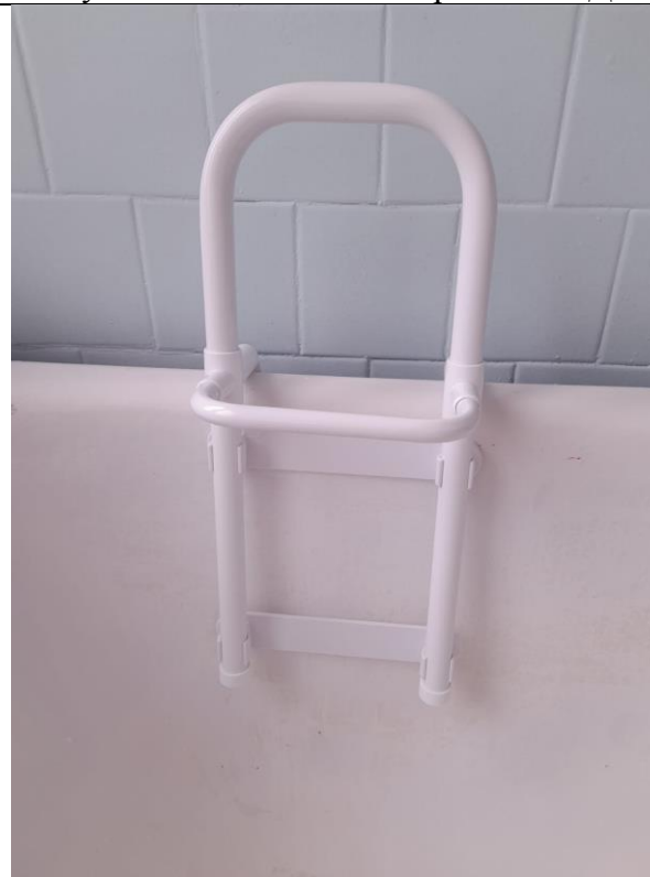
Поручень на бортик ванны Primanova