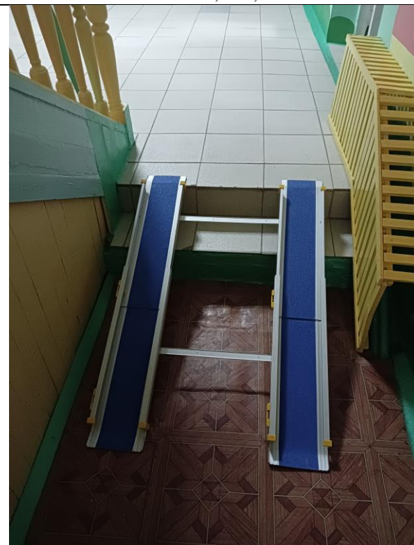
Мобильный пандус телескопический 2-ух секционный МЕГА 2ПТ-120