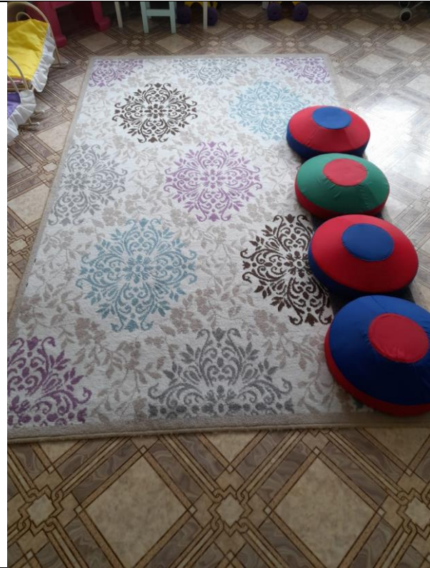
Ковер Соло прямоугольный 150*230