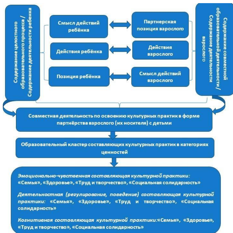
Рис. 1. Структурная модель содержания образовательной деятельности

Содержание деятельности взрослого по созданию условий в процессе приобретения детьми ценностей включает описание основных действий взрослого по формированию ценностных ориентиров детей как социально-обусловленного отношения их к окружающему миру, понимание, осознание и принятие ими социально значимых ценностей, сформированных в группы ценностных ориентиров: «Семья», «Здоровье», «Труд и творчество», «Социальная солидарность», которые приобретают для него личностный смысл и выступают регулятором поведения (рис. 2).