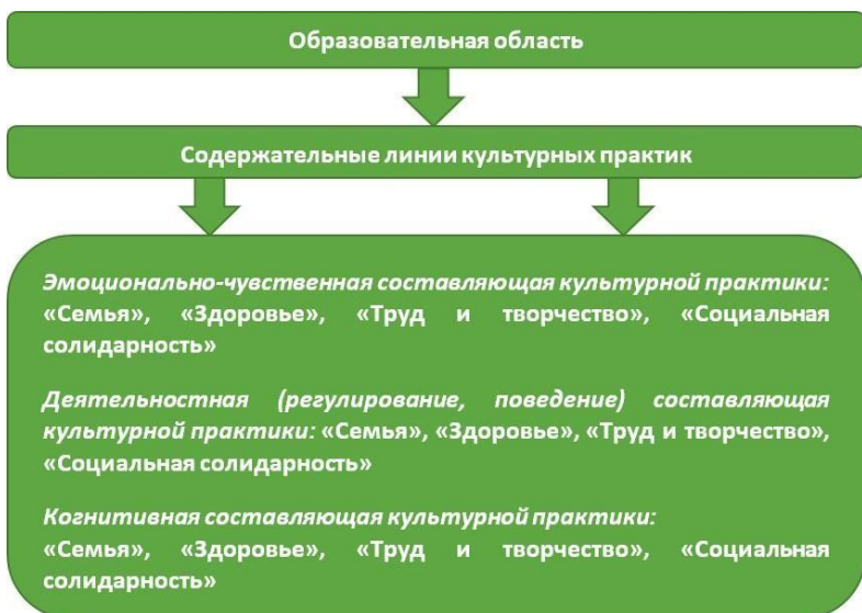
Рис. 2. Модель реализации содержания образовательной области